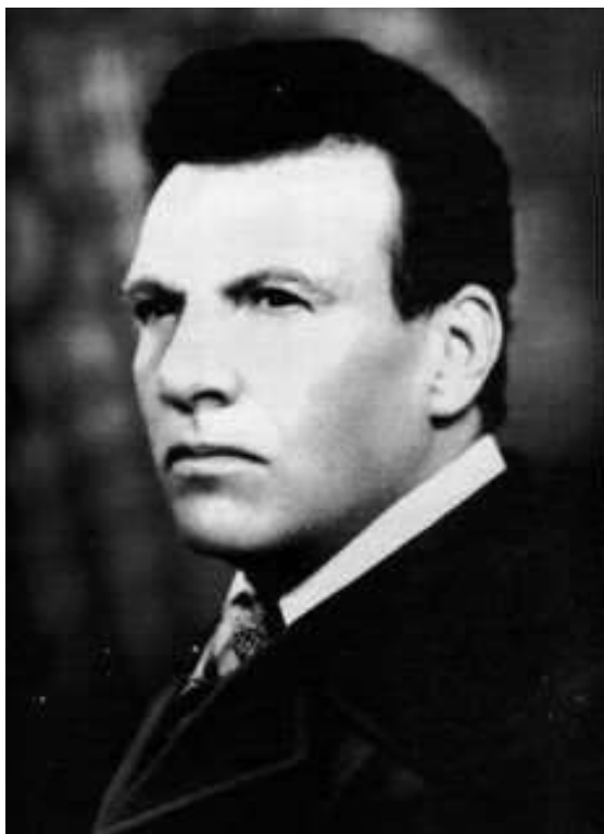
VM SAMAEL AUN WEOR